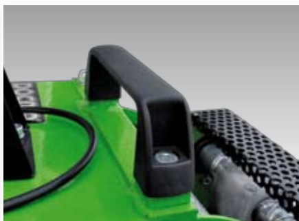
Maniglia, Handle, Haltegriff, Poignée