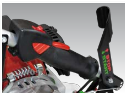
Impugnatura comando, Control handle, Steuergriff, Poignée commandes