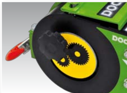
Pomello per folle, Coupling knob, Eintrittslochs, Pommeau d'accrochage.