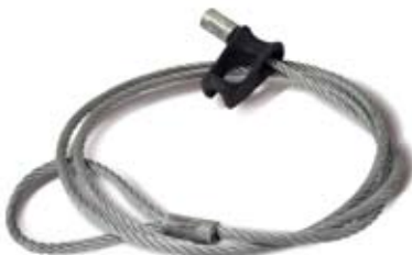
Cavo Choker, Choker cable, Chokerseile, Câble Choker