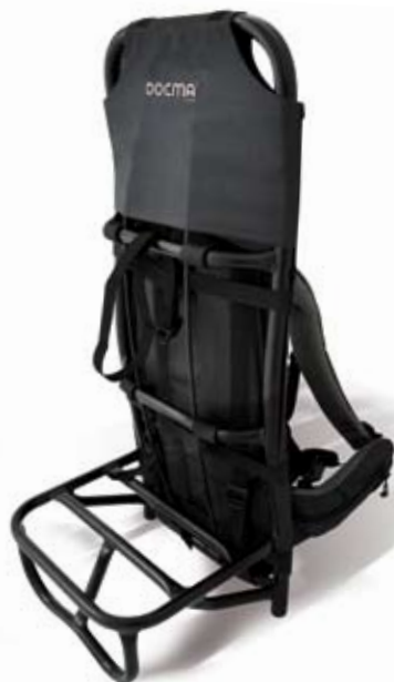
Zaino per verricello, Winch rucksack, Tragetornister für Winde, Sac pour treuil