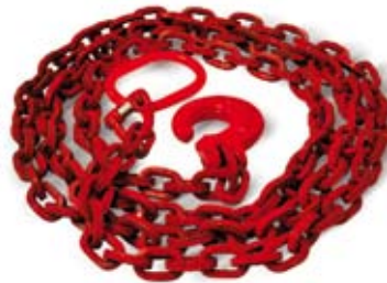
Catena, Chain, Forstketten, Chaîne