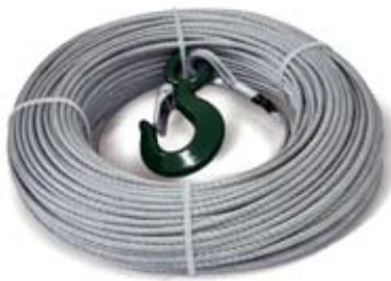
Fune, Cable, Windenseile, Câble

L'utilisation des accessoires, comme la poulie pour dévier le câble, l'élingue pour protéger les arbres, ainsi que les câbles et les chaînes certifiées, garantissent une sécurité maximale pour les personnes et l'environnement.