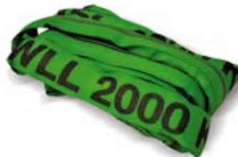
Braca, Sling, Schlingen, Élingue