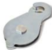
Carrucola, Pulley, Umlenkrollen, Poulie