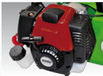
Motore, Engine, Motor, Moteur